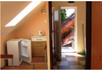
RECEPCJA - RE3