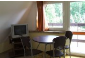
POLSPORT - PS6