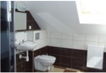
RECEPCJA - RE3