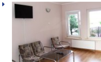
RECEPCJA - RE5