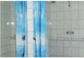
BRDA I - BR1