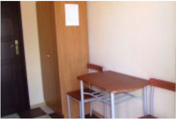
RECEPCJA - RE4