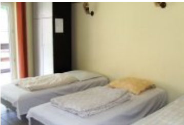
POLSPORT - PS4