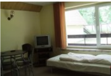
POLSPORT - PS4