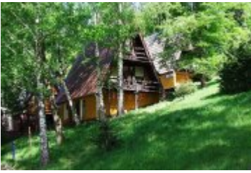
BRDA I - BR1

zobacz galerię: POLSPORT - PS6 2016-12-16