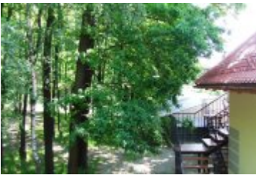
RECEPCJA - RE3