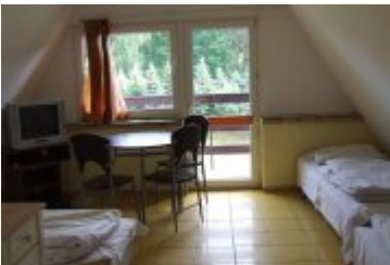
POLSPORT - PS6