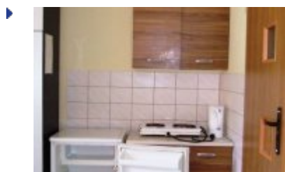
POLSPORT - PS3

zobacz galerię: POLSPORT - PS2 2016-12-16