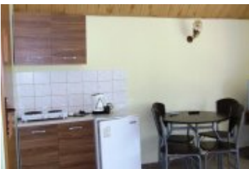
POLSPORT - PS4