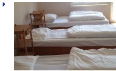
RECEPCJA - RE5

zobacz galerię: RECEPCJA - RE4 2016-12-16