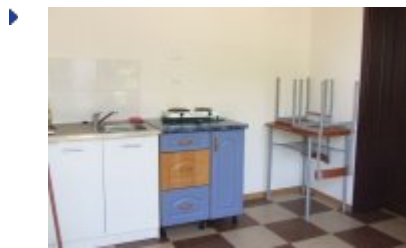
RECEPCJA - RE5