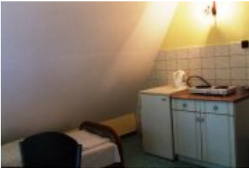
POLSPORT - PS5