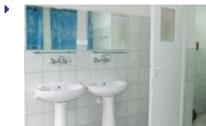
BRDA I - BR2