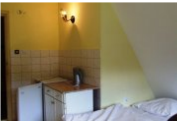
POLSPORT - PS6

zobacz galerię: POLSPORT - PS5 2016-12-16