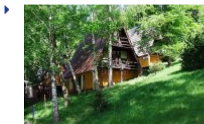
BRDA I - BR2