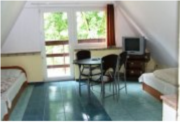
POLSPORT - PS5

zobacz galerię: POLSPORT - PS4 2016-12-16