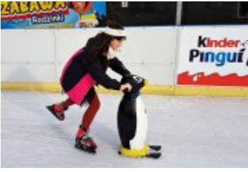
FERIE 2018 ZA NAMI

zobacz galerię: BAL PRZEBIERAŃCÓW NA LODOWISKU 2018-01-27