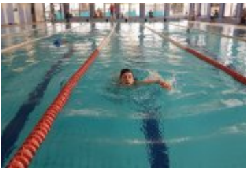
FERIE 2018 ZA NAMI