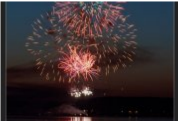
Festiwal Ognia i Wody