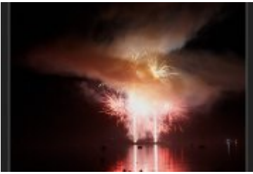
Festiwal Ognia i Wody

zobacz galerię: OTYLIADA 2018 2018-03-11