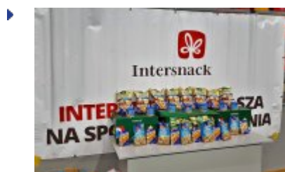
Druga Sobota Siatkarska