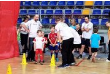
Galeria zdjęć z pierwszej soboty siatkarskiej