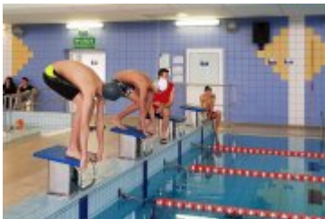
Zawody Pływackie Ferie 2018