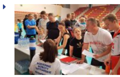
Druga Sobota Siatkarska