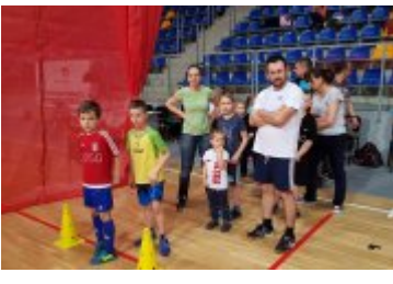
Galeria zdjęć z pierwszej soboty siatkarskiej

zobacz galerię: Festiwal Ognia i Wody 2018-03-26