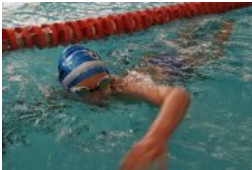
Zawody Pływackie Ferie 2018