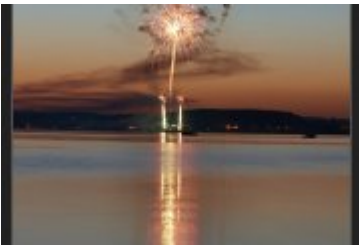
Festiwal Ognia i Wody