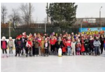
FERIE 2018 ZA NAMI