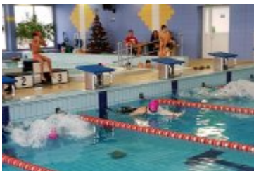
Zawody Pływackie Ferie 2018