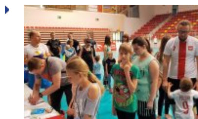
Druga Sobota Siatkarska