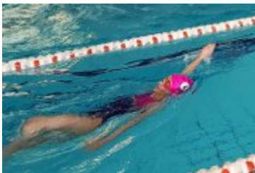
Zawody Pływackie Ferie 2018