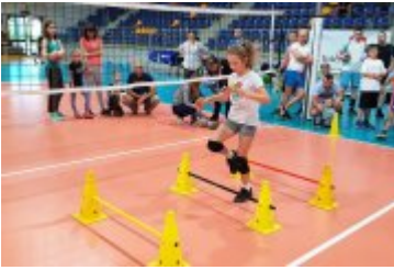
Druga Sobota Siatkarska

zobacz galerię: RODZINNE SOBOTY SIATKARSKIE - INTERSNACK 2018-03-26