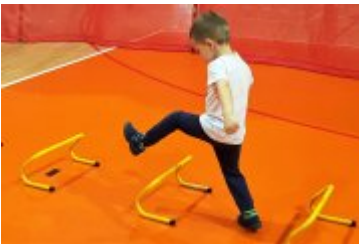
Galeria zdjęć z pierwszej soboty siatkarskiej