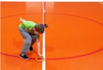
Galeria zdjęć z pierwszej soboty siatkarskiej