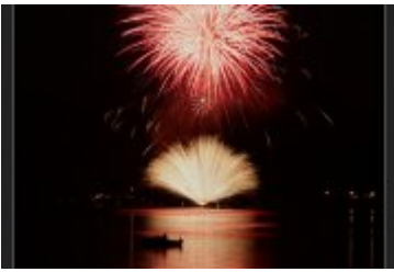
Festiwal Ognia i Wody