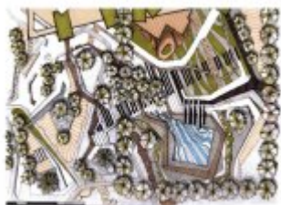
Konceptcja zabudowy Stadionu Miejskiego

Prezentujemy trzy koncepcje architektoniczno-urbanistyczne inwestycji mieszkaniowej wraz z inwestycjami towarzyszącymi. Przedstawiamy zmiany sposobu użytkowania w ramach rewitalizacji terenu Stadionu Miejskiego "Stali Nysa" przy ul. Kraszewskiego w Nysie, na rzecz zabudowy wielorodzinnej, o podwyższonych standardach zamieszkania, z przedszkolem trzy oddziałowym oraz kortami tenisowymi i lodowiskiem Agencji Rozwoju Nysy. Opracowanie powstało na zamówienia Gminy Nysa i ARN, autorem jest Instytut Terytorialnego Rozwoju eRegionu Nysa APPA Archikon DOBROWOLSKI.