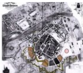
Konceptcja zabudowy Stadionu Miejskiego