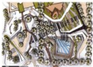
Koncepcja zabudowy Stadionu Miejskiego

Prezentujemy trzy koncepcje architektoniczno-urbanistyczne inwestycji mieszkaniowej wraz z inwestycjami towarzyszącymi. Przedstawiamy zmiany sposobu użytkowania w ramach rewitalizacji terenu Stadionu Miejskiego "Stali Nysa" przy ul. Kraszewskiego w Nysie, na rzecz zabudowy wielorodzinnej, o podwyższonych standardach zamieszkania, z przedszkolem trzy oddziałowym oraz kortami tenisowymi i lodowiskiem Agencji Rozwoju Nysy. Opracowanie powstało na zamówienia Gminy Nysa i ARN, autorem jest Instytut Terytorialnego Rozwoju eRegionu Nysa APPA Archikon DOBROWOLSKI.