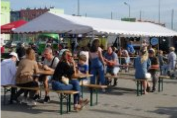
Zlot Food Trucków