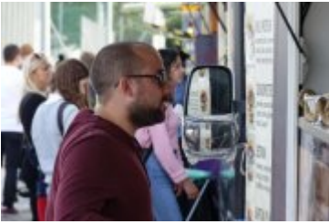
Zlot Food Trucków