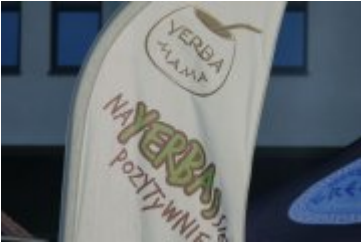
Zlot Food Trucków