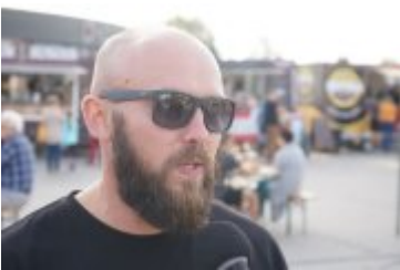
Zlot Food Trucków