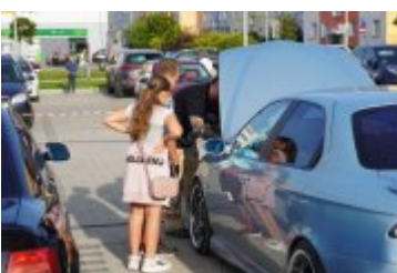
Zlot Food Trucków