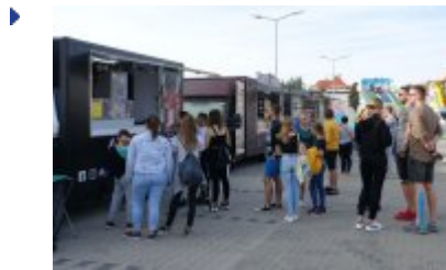
Zlot Food Trucków

W dniach 18-20 września pod Halą Nysa odbył się kolejny Zlot Food Trucków.