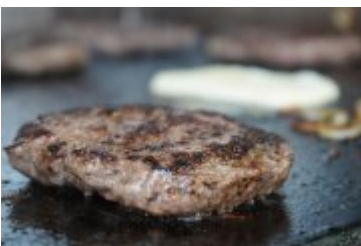
Zlot Food Trucków