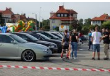
Zlot Food Trucków