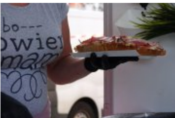
Zlot Food Trucków