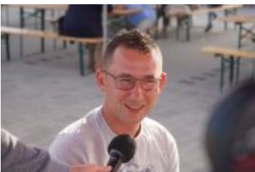
Zlot Food Trucków