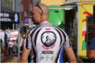
Zlot Food Trucków