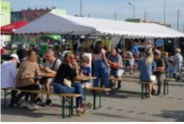
Zlot Food Trucków