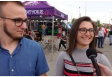
Zlot Food Trucków