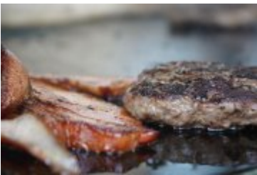
Zlot Food Trucków