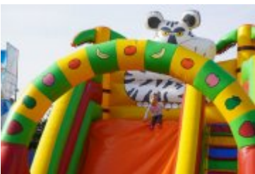
Zlot Food Trucków