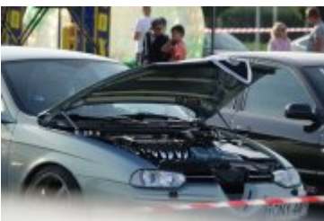
Zlot Food Trucków