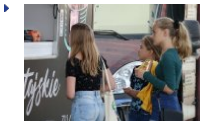
Zlot Food Trucków