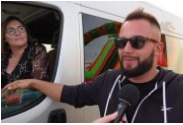
Zlot Food Trucków